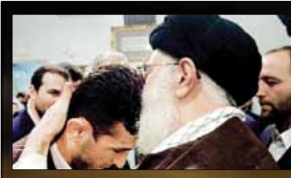
میراسماعیلی رئیس فدراسیون جودو:

بسیار هیجان‌زده هستیم. با پرسپولیس بازی داریم که بهترین تیم ایران است و می‌دانیم یک بازی سخت و دشوار برای ما خواهد بود که برای‌مان شبیه یک فینال است. پرسپولیس برای ما حرفه‌ای قدرتمند و دشوار خواهد بود و در این بازی باید سعی کنیم مالکیت توپ و کنترل بازی را در دست داشته باشیم... پرشور ترین مسابقاتی که در طول زندگی حرفه‌ای خود دیده‌ام، همیشه مقابل تیم‌های ایرانی از جمله پرسپولیس هستیم و این را به بازی‌یکناتم گفته‌ام که آنها همیشه با شور و شوق زیاد بازی می‌کنند، به همین دلیل ما هم باید بسیار پرشور باشیم، چون این یک فینال است.