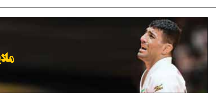
میراسماعیلی رئیس فدراسیون جودو: