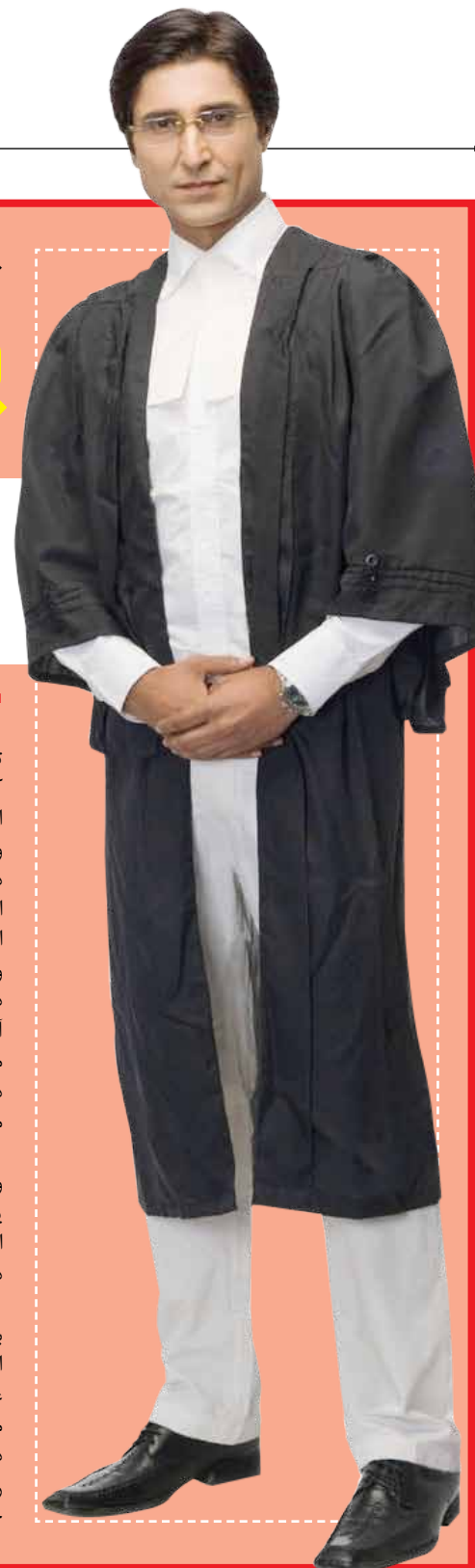
سخنگوی کمیسیون قضایی و حقوقی مجلس در گفت‌وگو با «وطن امروز»

با شرایطی که تا اینجا به تصویر کشیده شد، می‌توان بازار خدمات حقوقی در ایران را بازاری انحصاری نامید. یکی از پیامدهای بازار انحصاری، تنظیم عرضه کالا به وسیله عرضه‌کننده برای قرار گرفتن شاخص قیمت در بالاترین سطح ممکن است. حداکثری بودن قیمت یک کالا به این معناست که دریافت‌کنندگان کالاها و خدمات باید بیشترین هزینه ممکن را بپردازند. با در نظر گرفتن این نکته که دریافت‌کنندگان این خدمات عمدتاً مردم و تولیدکنندگان بخش خصوصی - به‌عنوان