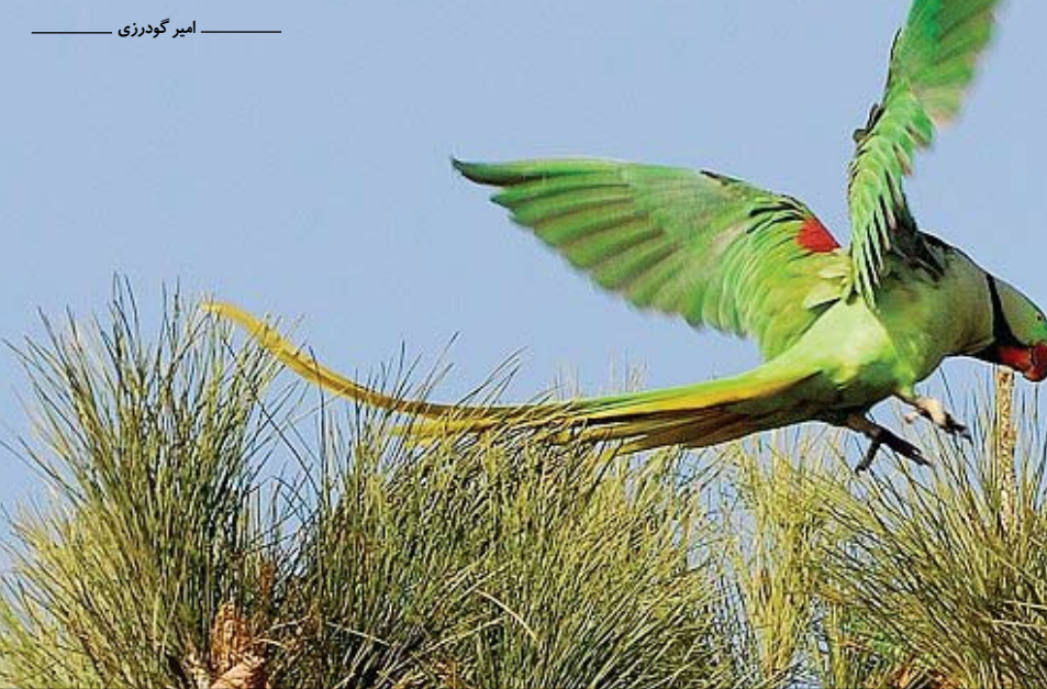
شله‌طوطی را در بسیاری از مناطق شمالی تهران می‌توان دید