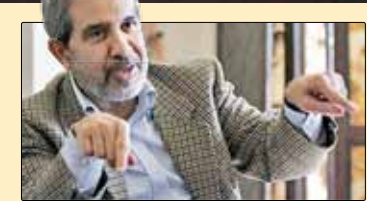
اینفانتینو بهتر است به جای اینکه برای بازی‌های داخلی که به او مربوط نیست فشار بی‌آورد، به فکر پول‌های بلوکه‌ما باشد تا این نمایش‌های سیاسی.