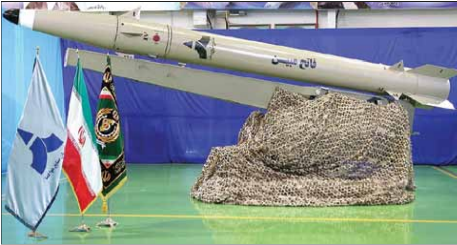
موشک فاتح در حال آزمایش

گروه سیاسی: روز دوشنبه جدیدترین موشک بالستیک ایرانی به نام «فاتح مبین» توسط امیر حاتمی، وزیر دفاع و پشتیبانی نیروهای مسلح رونمایی شد. این موشک در واقع نسل جدید موشک‌های نقطه‌زن فاتح ۱۱۰ محسوب می‌شود و از قابلیت استفاده علیه اهداف دریایی و زمینی برخوردار است و توانایی مقابله با جنگ الکترونیک را هم دارد.