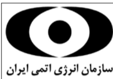
سازمان انرژی اتمی ایران

با گذشت کمتر از ۲ ماه از فرمان هسته‌ای اخیر رهبر معظم انقلاب اسلامی که در مراسم سالگرد بنیانگذار انقلاب اسلامی بیان شده بود، اقدامات گسترده و متنوع سازمان انرژی اتمی برای تحقق این فرمان و همچنین تلاش‌های این سازمان برای تولید و پیشرفت طرح پیشران هسته‌ای تشریح شد. در پی خروج ۲ ماه قبل آمریکا از برجام و انتظار