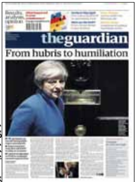
کارترین از اور به جعفر