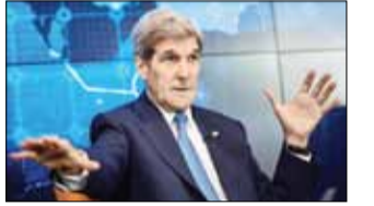
تعبیر جواد لاریجانی از تعهد ایران در برجام مبنی بر پر کردن مخزن آب سنگین

■ سران موساد و شین بت گفته‌اند از این طرح حمایت می‌کنند