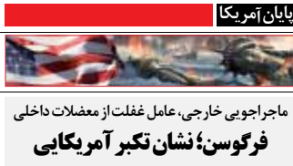
ماجراجویی خارجی، عامل غفلت از مغضلات داخلی