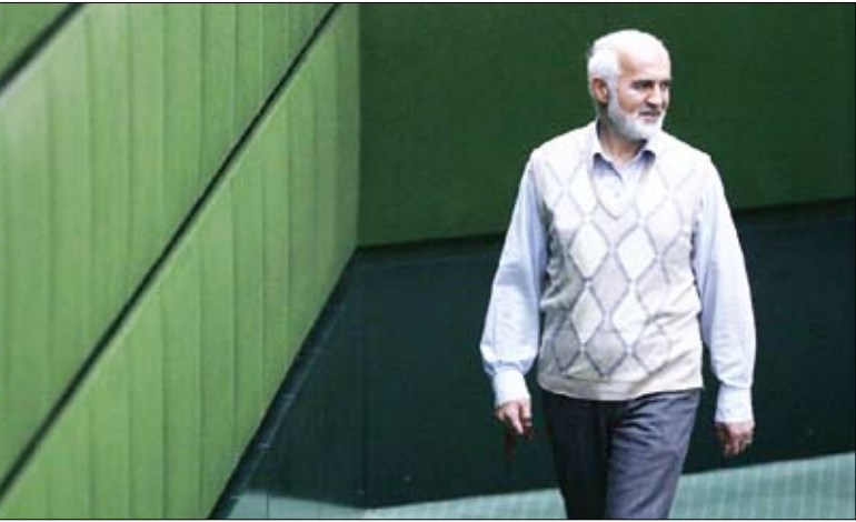
عسکریانوقضای سیاسی ووطن امروز

علیه‌احمدی‌نژاد تبلیغات روانی می‌کنند ایرنا: نماینده آشوریان در مجلس شورای اسلامی تأخیر آمریکا در صدور ویزا برای همراهان رئیس‌جمهور در سفر به سازمان ملل را غیرقابل توجیه و نشان‌دهنده عدم پایدندی آمریکایی‌ها به قوانین دموکراسی دانست. یوناتن بت کلیا با تأکید بر اینکه آمریکا موظف به اجرای منشور سازمان ملل درباره اعطای ویزا به همراهان سران کشورهای شرکت‌کننده در اجلاس سازمان ملل است، گفت: آمریکایی‌ها به‌خاطر تکبر و قلدری خود به دنبال پیشبرد اهداف و برنامه‌های خود هستند و ارزشی برای پروتکل‌های بین‌المللی قائل نیستند. بت کلیا عدم همکاری آمریکا در صدور ویزا را نشان‌دهنده عدم حاکمیت دموکراسی در این کشور دانست و تأکید کرد: مقامات این کشور برای بسته نگه داشتن فضا و دوری افکار عمومی از حقایق موجود دست به چنین اقداماتی می‌زنند.وی با اشاره به برنامه رئیس‌جمهوری برای ایستادن در دستور کار شورای‌عالی دینی در این سفر، گفت: حضور نمایندگان اقلیت‌های دینی به همه نشان خواهد داد که همه ادیبان ابراهیمی در کنار هم با صفا و صلح و صمیمیت زندگی می‌کنند. بر این اساس، عدم صدور ویزا به برخی همراهان رئیس‌جمهوری اشتباه و غیرقابل توجیه است.