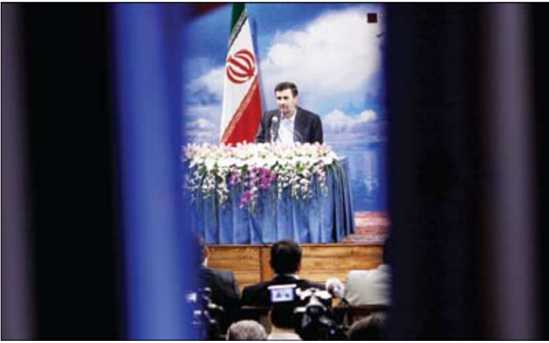
عکس علی احمدی نژاد امروز

گروه سیاسی ؛ پس گرفتن نامه معرفی وزرای پیشنهادی آموزش و پرورش و رفاه از مجلس شورای اسلامی همانطور که روز سه‌شنبه با شائبه‌هایی درباره دلایل اصلی این اقدام از سوی رئیس‌جمهور مواجه بود، روز گذشته نیز اظهار نظرهای متفاوت نمایندگان مجلس و دولت را به همراه داشت تا جایی که رئیس‌جمهور و نمایندگان دولت اعتقاد داشتند استرداد نامه معرفی وزیران به مجلس به دلیل همزمانی آن با تعطیلات تابستانی نمایندگان و لابی‌های بوده و نمایندگان مجلس بر این باورند که توصیه‌های رهبر انقلاب به اعضای کابینه دهم و رئیس‌جمهوری برای توجه به خواست‌ها و نظرات علما و مراجع باعث شده است رئیس‌جمهور در معرفی وزیر زن به مجلس تردید داشته باشد. اما همانطور که روز سه‌شنبه مشاور معاون پارلمانی رئیس‌جمهور نیز اعلام کرد روز گذشته رئیس‌دفتر رئیس‌جمهور نیز در حاشیه مراسم تودیع و معارفه وزیران پیشین و فعلی علوم، تحقیقات و فناوری در جمع خبرنگاران تصریح کرد: علت پس گرفتن نامه معرفی وزرا، تعطیلات مجلس بوده است.