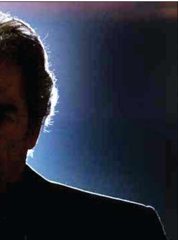
عین وطن امروز

بازیگر فیلم باد، ولی چون تهیه‌کنندگان با کارگردان به توافق نرسیدند او کارگردانی «فانسون» را هم عهده‌دار شده است.